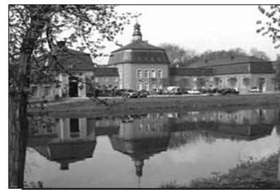
Pferdezentrum Schloss Wickrath – Schlossanlage Wickrath