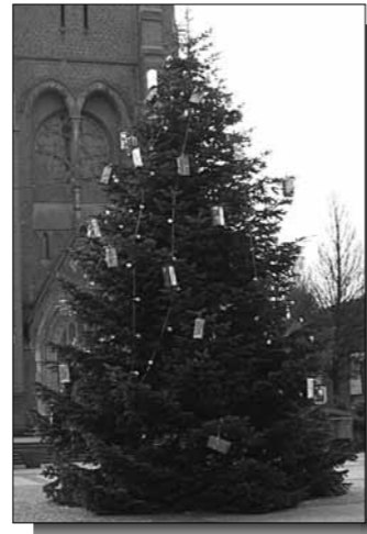
Gewerbing-Weihnachts-Tanne auf dem Konstantinplatz.

O Tannenbaum, o Tannenbaum, wie grün sind deine Blätter. Du grünst nicht nur zur Sommerzeit, nein auch im Winter wenn es schneit.